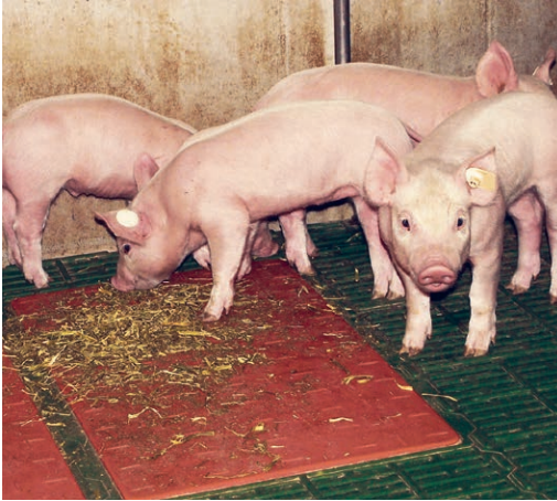
Raufuttergaben sind auch für die Magen-Darm-Gesundheit der Saugferkel wichtig.