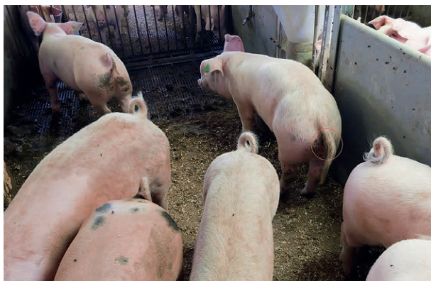
Hängende oder zwischen den Hinterbeinen geklemmte Schwänze sind ein Alarmsignal.

Das Verhalten der Tiere ändert sich oft schon einige Tage vor einem „Ausbruch“.