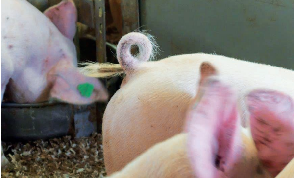
Ein intakter Ringelschwanz als Indikator für Tiergesundheit.