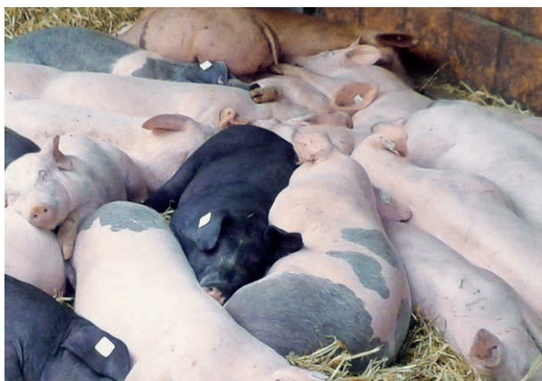
Schweine ruhen gerne in Gruppen – Beispiel für einen Liegebereich.

Die bauliche Umsetzung für die Ermöglichung der Einrichtung von Funktionsbereichen kann beispielsweise durch Trennelemente oder durch eine unterschiedliche Bodengestaltung (Teilspalten mit eingestreuter Liegefläche) und Höhenunterschiede des Buchtenbodens erfolgen.