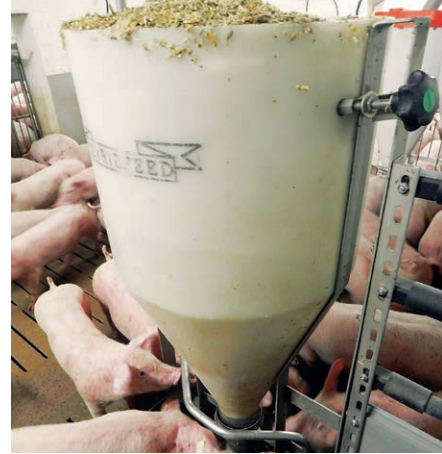
Beispiel für Raufuttergaben.