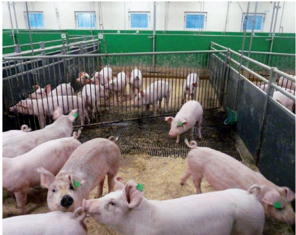
Beispiel aus Norwegen: Trennung von Kot- und Aktivitätsbereich.

Schweine in freier Natur üben verschiedene Verhaltensweisen (Fressen, Erkunden, Wühlen, Koten, Ruhen, Spielen u. a.) an verschiedenen Orten aus und dies meist gemeinsam in der Gruppe. Sie sind reinliche Tiere, die ihre Ruhe- und Aktivitätsbereiche sauber halten, wenn ihnen die Möglichkeit dazu gegeben wird. Diese Bedürfnisse sind auch den heutigen Zuchtlinien der Hausschweine erhalten geblieben. Um diese Bedürfnisse zu erfüllen, müssen Haltungssysteme für Schweine ausreichend Platz und die Möglichkeit zur Schaffung verschiedener Funktionsbereiche bieten. Dies ist essenziell, um Stress und der Entwicklung von Verhaltensstörungen vorzubeugen und die Tiergesundheit zu erhalten.