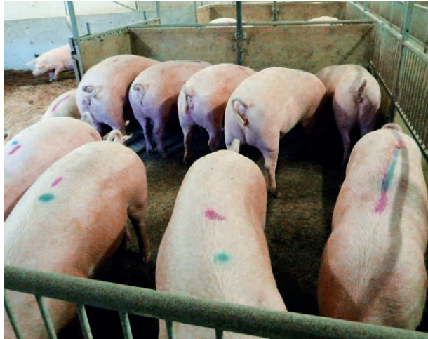
Gleichzeitiges Fressen entspricht dem natürlichen Verhalten der Tiere.

Hält man Hausschweine in einer natürlichen Umgebung, verbringen sie etwa 75 % ihrer Aktivitätszeit mit Futtersuche und Fressen. Schweine sind Allesfresser, die eine breite Nahrungspalette von energie- und proteinreich bis hin zu strukturiert und rohfaserhaltig aufnehmen. In der Gruppe fressen sie bevorzugt gleichzeitig. Eine ausgewogene und tiergerechte Fütterung von Schweinen berücksichtigt somit neben dem physiologischen Nährstoffbedarf des Tieres auch deren Bedürfnisse, wie Kauen, Sättigung und eine intakte Magen-Darm-Gesundheit. Auch die Darreichung von Futter und Wasser hat Einfluss auf das Wohlbefinden des Schweines und ist somit bei der Prävention von Verhaltensabweichungen, wie Schwanzbeißen, zu berücksichtigen.