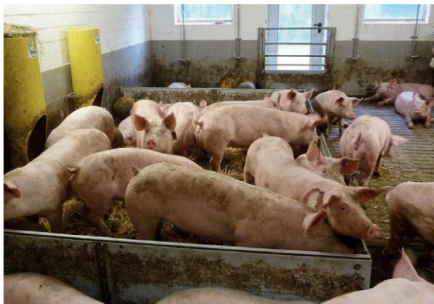
Eingestreuter Wühlbereich für eine Großgruppe.

Am besten eignen sich solche Beschäftigungsmaterialien, die die Grundbedürfnisse eines Schweines weitestgehend erfüllen. Damit verringert sich auch das Risiko, dass Schwanzbeißen auftritt, wie Studien aus mehreren europäischen Ländern bestätigen. Materialien, die das Interesse der Schweine dauerhaft wecken können, sind fressbar, kaubar, wühlbar und veränderbar. Durch den Einsatz solcher Materialien und durch das Ermöglichen einer ungestörten Beschäftigung aller Tiere gleichzeitig (insbesondere bei erneuter Vorlage von wühlbarem Material!) wird das natürliche Verhalten der Nahrungssuche in der Regel weitestgehend befriedigt. Falls es sich um fressbare Materialien handelt, sollen diese auf jeden Fall strukturiert sein (z. B. Raufutter). Sehr attraktiv für Schweine sind auch wechselnde Materialien oder täglich frische Gaben eines Materials. Wichtig ist zudem, dass Schweine schon früh lernen, sich mit diesen Materialien zu beschäftigen. Geeignete Beschäftigungsmaterialien sollten deswegen schon im Saugferkelalter angeboten werden. Grundsätzlich ist es wichtig, dass die eingesetzten Beschäftigungsmaterialien gesundheitlich unbedenklich sind.