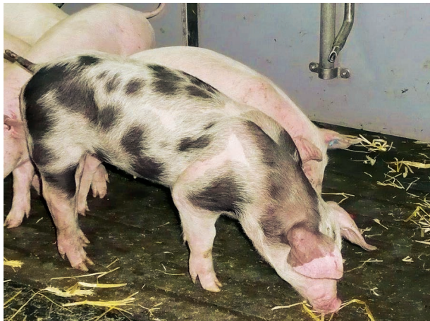
Beschäftigungsmaterial in bodennaher Ausbringung kommt dem Tierverhalten entgegen.

Wühlen und Erkunden gehören zu den Grundbedürfnissen eines Schweines. Der Ursprung dieses Bedürfnisses liegt bei den Vorfahren unserer Hausschweine. Wildschweine verbringen täglich viele Stunden mit ihrer Nahrungsbeschaffung. Dazu wühlen und graben sie nach Wurzeln, benagen Äste, fressen Gras, suchen nach Eicheln und fressen auch Insekten und Würmer. Fress- und Erkundungsverhalten sind synchronisiert: Die Tiere bevorzugen es, gemeinsam zu fressen und nach Nahrung zu suchen. Dieses sogenannte Futtersuchverhalten ist bei unseren Hausschweinen erhalten geblieben. Bringt man sie in ein naturnahes Freigehege, dann verbringen unsere domestizierten Schweine, auch bei Zufütterung, 75 % ihrer Tagesaktivität mit der Nahrungssuche. Wenn diese intelligenten und neugierigen Tiere in einer reizarmen Umgebung gehalten werden, in der keine Beschäftigungsmöglichkeiten vorhanden sind, entstehen leicht Verhaltensstörungen, wie zum Beispiel Schwanzbeißen.