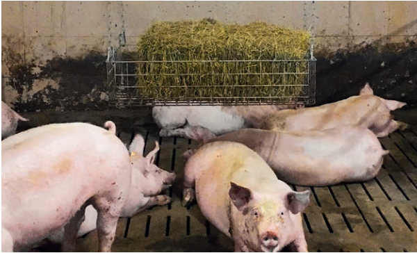
Angebot von Beschäftigungsmaterial in einer Raufe.