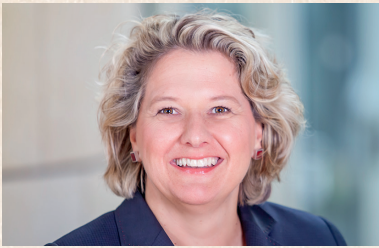
Svenja Schulze Bundesumweltministerin