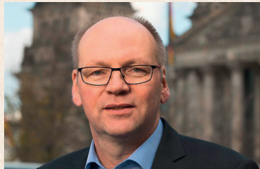
Bernhard Krüsken Generalsekretär des deutschen Bauernverbandes