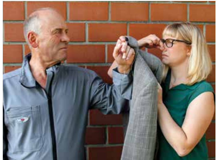
Beide Overalls sind sehr stabil. Die kräftigen Bissattacken der Schweine meisterten beide Modelle mit Bravour.