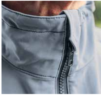
Beim Overall von Hairtex schützt eine Lasche am Reißverschluss das Kinn.