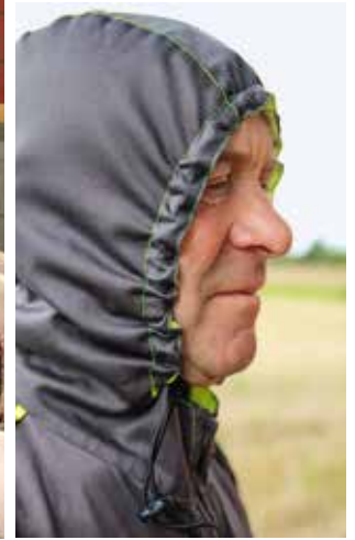
Der Farmsuit der Firma HappyWorkWear besitzt eine Kapuze, die das Haar vor Geruch schützt.

leichter als handelsübliche Overalls aus Baumwolle. Der Farmsuit bringt knapp 1000 g auf die Waage, der Hairtex-Overall ist mit 800 g sogar noch etwas leichter.