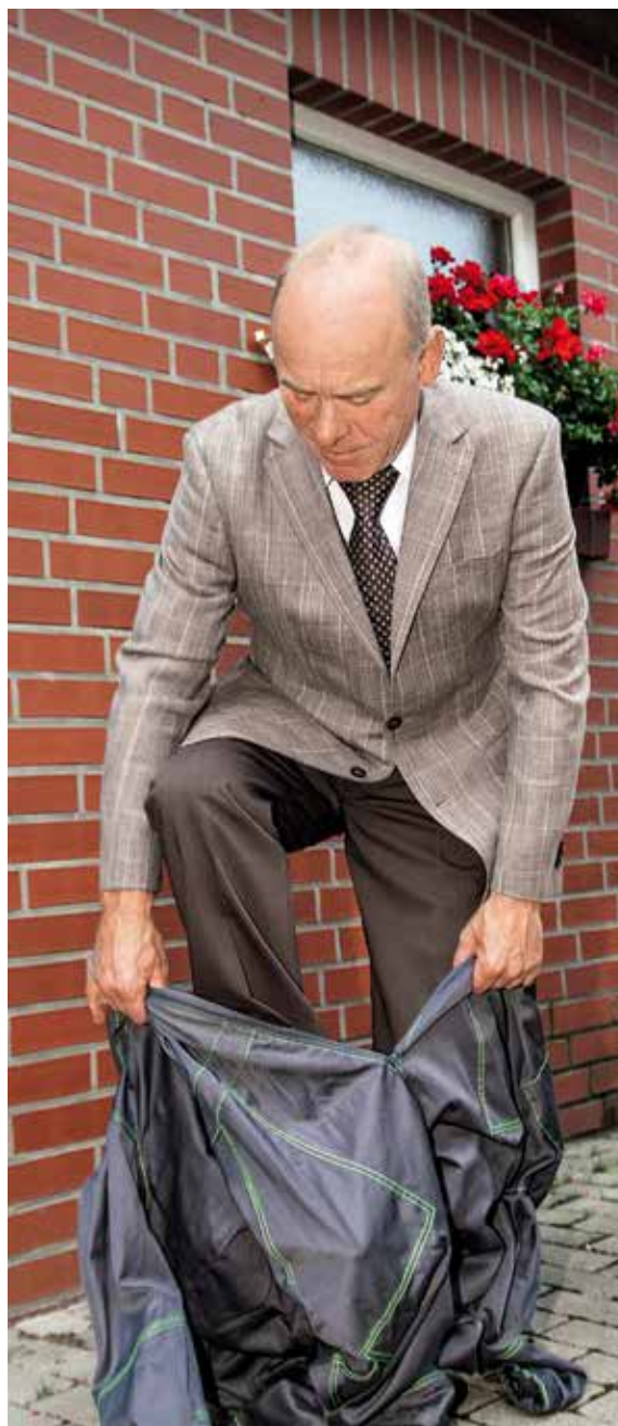
Hält der Overall Stallgeruch tatsächlich ab? Unser Tester hat sich in Schale geworfen und hat es ausprobiert.

In unserem Praxistest haben wir einen Schweinemäster gebeten, den „Farmsuit“ der niederländischen Firma „HappyWorkWear“ und den Overall der bayerischen Firma „Hairtex“ zu testen. Zehn Tage lang hat unser Tester jeden Overall für jeweils eine Stunde bei der morgentlichen Tierkontrolle getragen. Der Stallgeruch ist anschließend mehrfach selbst überprüft und zusätzlich durch Dritte bewertet worden.