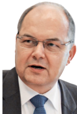
Christian Schmidt, Bundes- landwirtschaftsminister