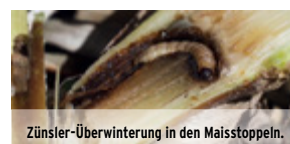
Zünsler-Überwinterung in den Maisstoppeln.

Video: Richten Sie die Kamera Ihres Smartphones auf den QR-Code, dann starten Sie das Video.