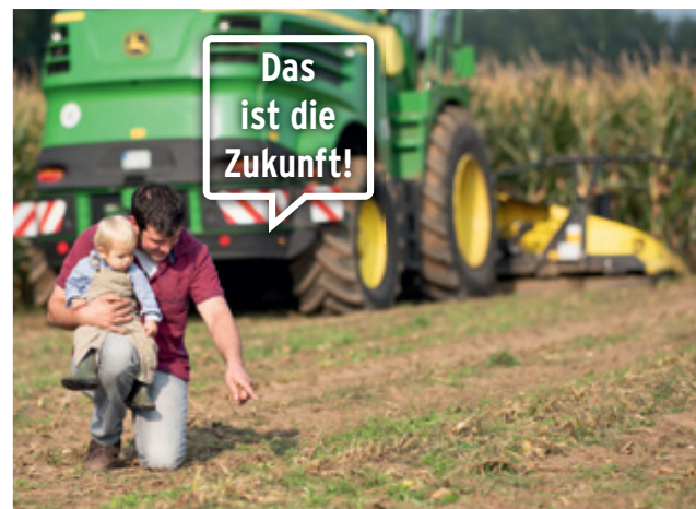
Der Kemper-StalkBuster ist für die meisten Feldhäcklermarken verfügbar.